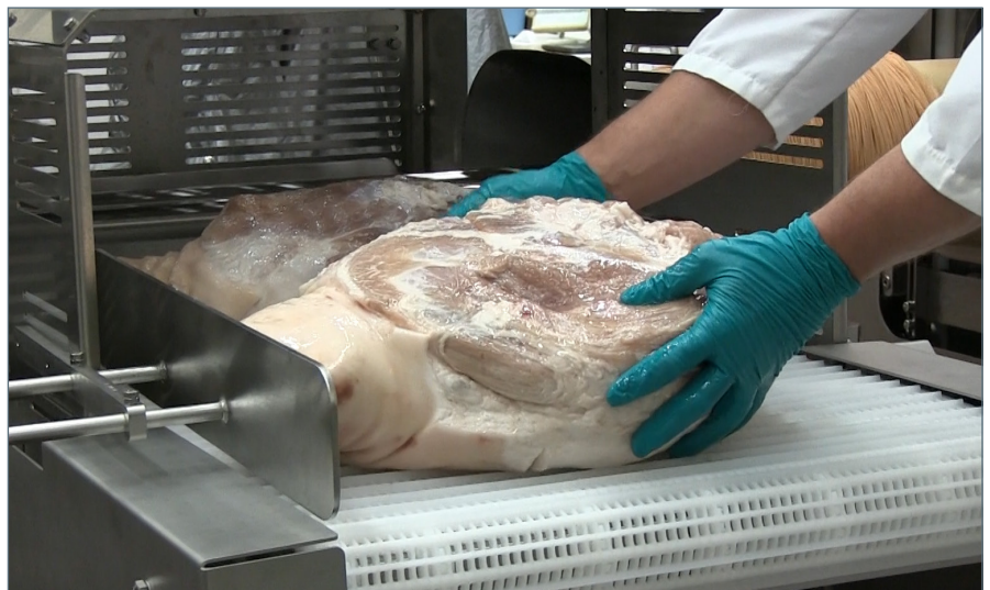
Das Design des TN2001 Förderwerks sorgt für einheitlich ausgerichtete Schinken.

Der TN2001 ist mit einem speziellen Förderwerk ausgerüstet, das eine gleichmäßige Produktausrichtung und -zuführung für einheitliche Endprodukte sicherstellt. Mithilfe des pneumatischen Löffels kann der Schinken während des Einschubens noch besser gesteuert werden. Das Ergebnis ist ein einheitlich ausgerichteter