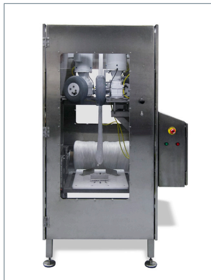
Raffmaschine Modell RLB

Weiter führende Informationen finden Sie in der TIPPER TIE Raffmaschinen-Broschüre.