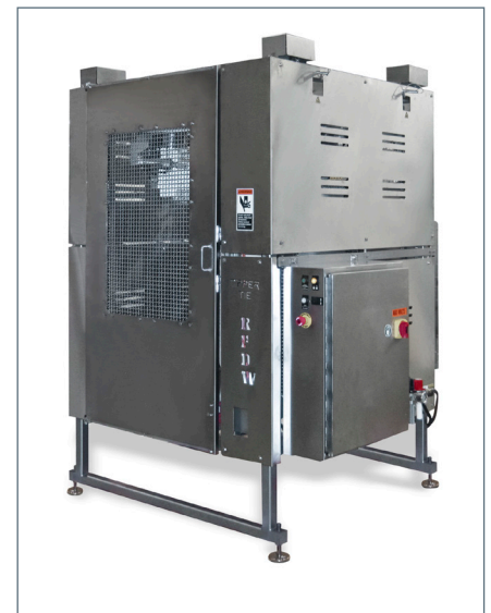
Raffmaschine Modell RFDW1

TIPPER TIE Inc. 2000 Lufkin Road Apex, NC 27539 USA Tel. +1 919 362 8811 Fax +1 919 362 4839 infoUS@tippertie.com